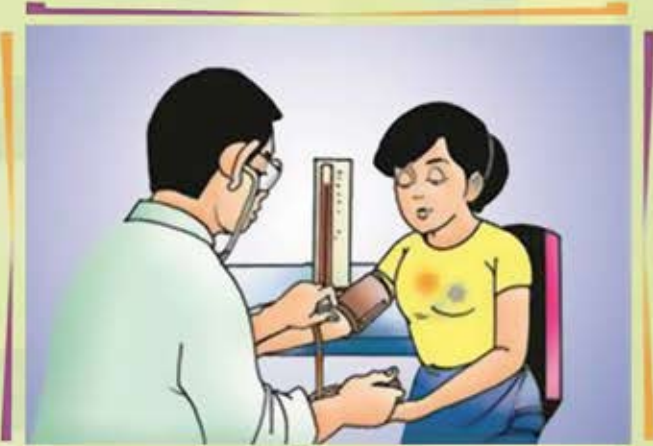
နှလုံးသွေးကြောရောဂါထိန်းသိမ်းရေးစီမံချက်

ထို့ကြောင့် သွေးတိုးရောဂါရှိ / မရှိ သိရှိရန် သင့် သွေးပေါင်ချိန်ကို ယနေ့ချိန်ကြည့်ပါ။