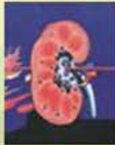
ကျောက်ကပ်ပျက်ခြင်း

သွေးတိုးရောဂါဖြစ်လာလျှင် ဆေးဝါးများ ငုံ့မန့်မီဝဲပါ။