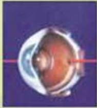
မျက်စိကွယ်ခြင်း