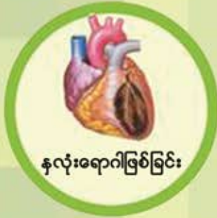
နှလုံးရောဂါဖြစ်ခြင်း